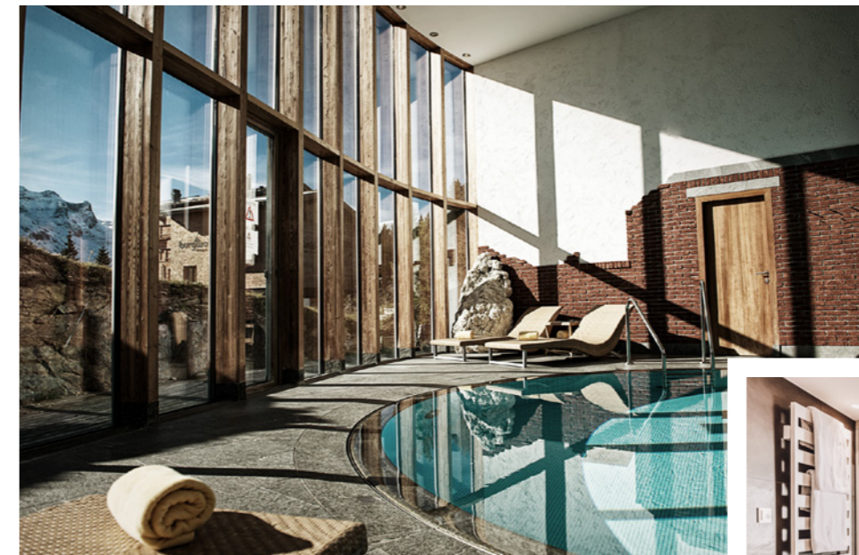
Mountain Retreat, Schwimmen mit alpiner Aussicht, in frischem, warmem Wasser aus der Bergquelle.