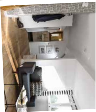
St. Peter Ording/Deutschland

Räumlichkeiten. Im lounge- und Clubrestaurant darf Sie Ihr Vierbeiniger Liebling zum Frühstück, mittags zu einem kleinen Snack à la carte als auch zum Abendessen jederzeit begleiten. Während Sie Aktivitäten erleben, bei denen sich ein Hund nicht so wohlfühlt, können Sie den Service eines liebevollen und professionellen Dogsiters in Anspruch nehmen. Buchbar ab drei Stunden für 65 €. Gerne bereiten die Hotelköche das Futter für die Hunde mit frischen Zutaten der heimischen Bio-Bauern zu. Auch eine energetische Heilreise für Mensch und Hund mit Therapeu-