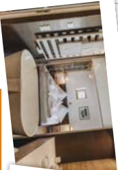
Oberlech am Arlberg, Österreich